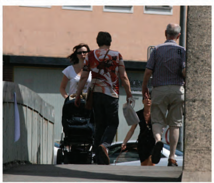
- Brücke in der Gartenfeldstraße mit Blick auf den Hauptbahnhof -